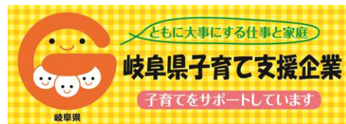
「子育て支援企業ステッカー」(8cm×22センチ)