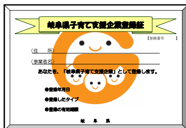
「岐阜県子育て支援企業登録証」(A4サイズ)